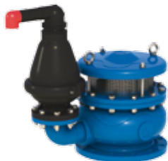
VB-060 + D-025

ניתן לקבל שובר ואקום מדגם VB-060 המשלב שסתום אוויר כתוספת לשסתום הבסיסי של שובר הואקום. בחירת סוג וקוטר של שסתום האוויר הנוסף יהיו תלויים באופי השימוש (מים או שפכים) ובקוטר השסתום הנדרש. יש לעיין בטבלה הבאה כדי לראות את האפשרויות הקיימות עבור שסתומי אוויר נוספים.